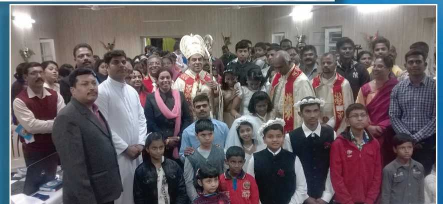
His Grace with Syro-Malabar Community during Holy Communion of the newly formed SM community in Battinda, Punjab