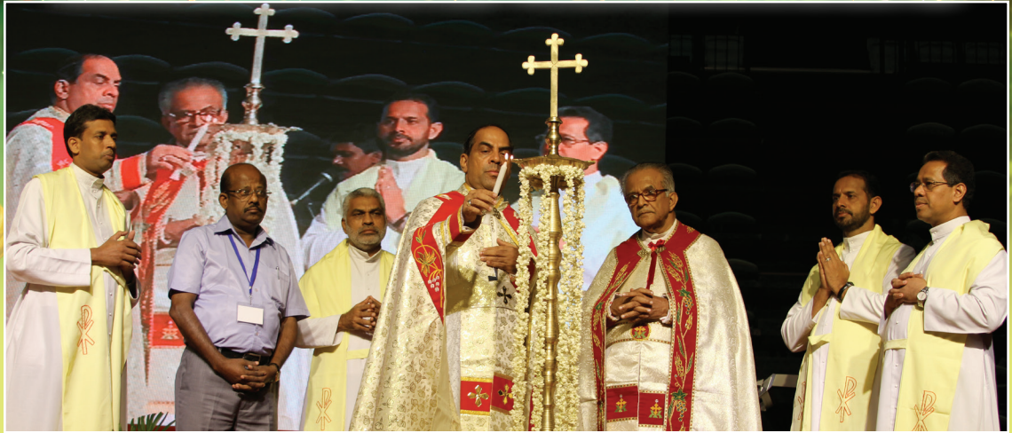
Archbishop inaugurating 6th Santhome Bible Convention at Thyagaraj Stadium, INA, Delhi