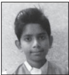
GROUP B DIOCESE RANK – III ANTO BOBBY St. Mary's Church, Mayur Vihar Phase I