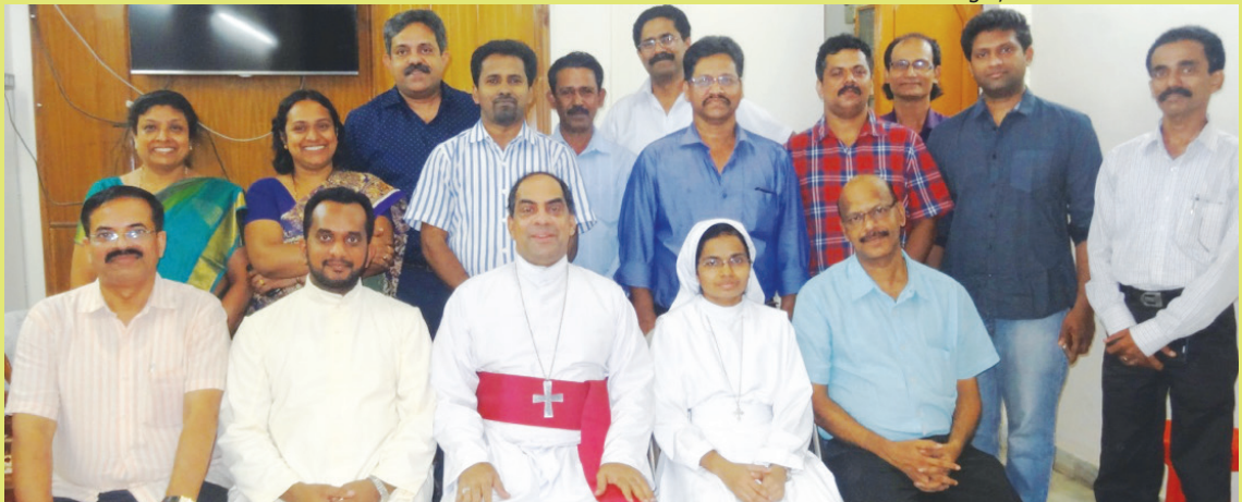
Archbishop with Parish Council Members of St. Mary's Parish, Mayur Vihar I