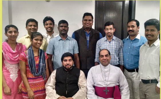
Jesus Youth, Faridabad Diocesan Service Team with Archbishop