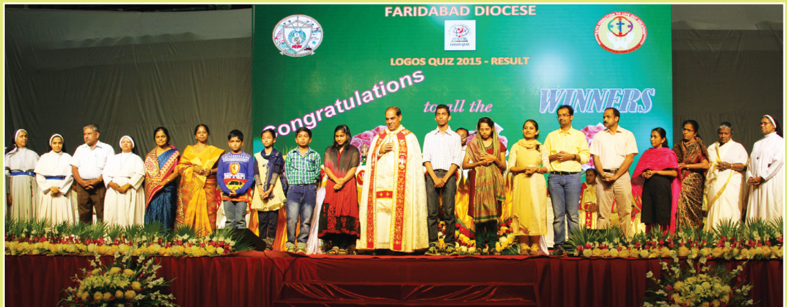
Felicitating Logos Quiz winners at Diocesan level