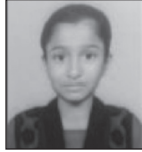
GROUP A DIOCESE RANK – II BLISMOL BENNI Assumption Forane Church, Mayur Vihar III