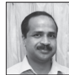
GROUP D DIOCESE RANK – I JAISION P.V. Sacred Heart Forane Church, Gurgaon