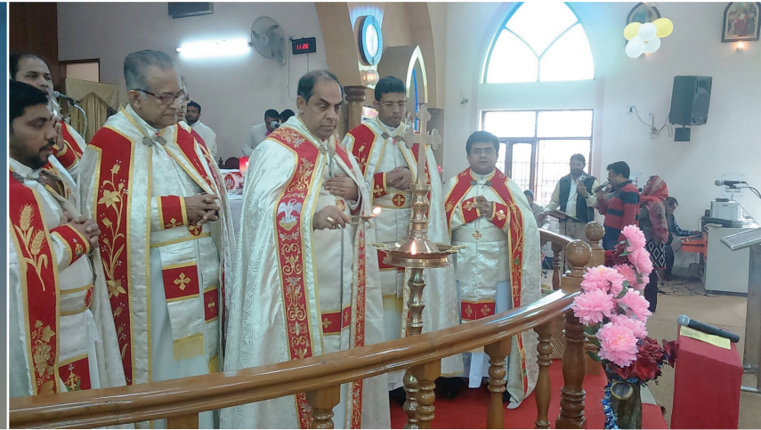
Archbishop inaugurating 'Year of Mercy' at Kristuraja Cathedral, Faridabad