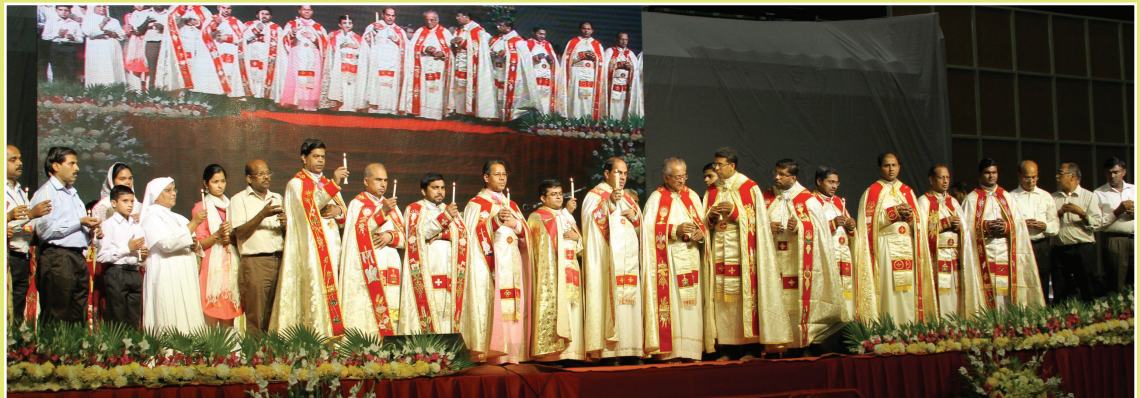
Inaugurating of Silver Jubilee Year of Delhi Syro-Malabar Mission (1991 – 2015)