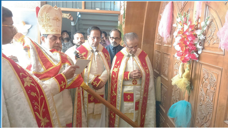
His Grace opening 'Door of Mercy' in the Kristuraja Cathedral, Faridabad, formally launching the 'Holy Year of Mercy' in the diocese.