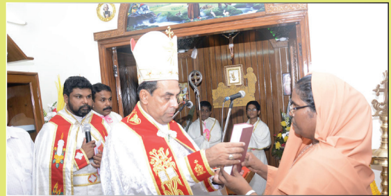
Blessing the new Convent Assisi Bhavan of Sisters of St. Francis at Harinagar, New Delhi