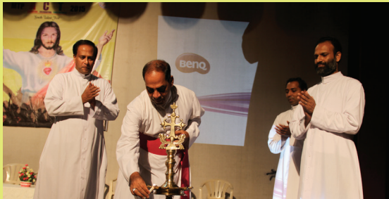
Inaugurating residential retreat/talent fest organized by DSYM BI, Mother Teresa Parish