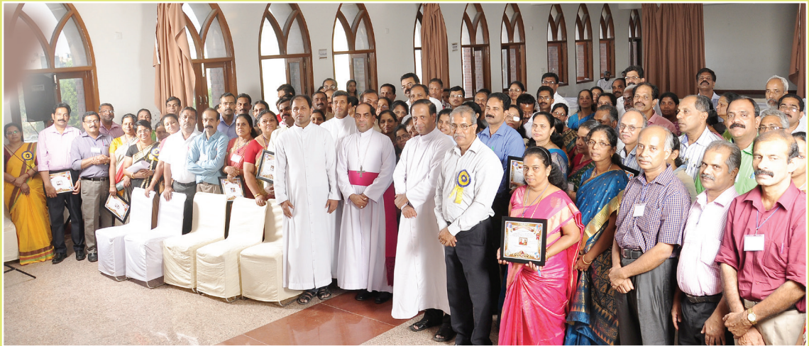
Jubilarian couples with Archbishop on the occasion of Jubilarians Meet 2015 organized by Department of Family Apostolate, Diocese of Faridabad-Delhi