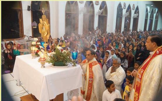
Archbishop leading adoration during first anniversary of evening vigil at Our Lady of Fatima Forane Parish, Jasola